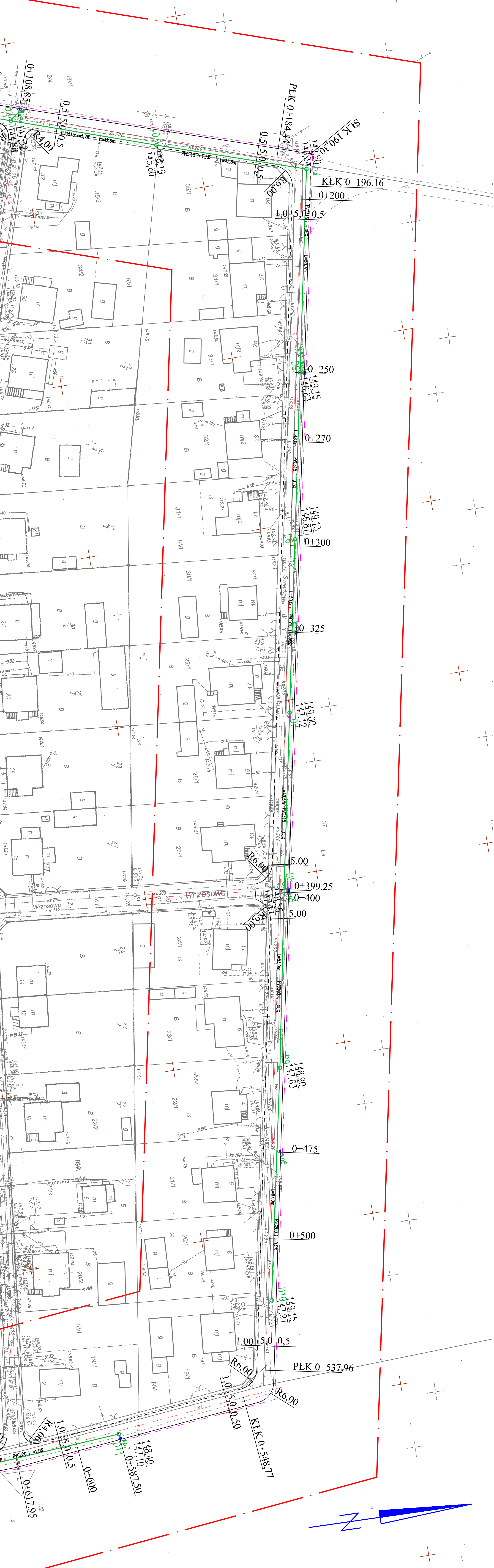
RYSUWNEK PODŁADOWY UKŁADU MAPY MAPA 2/3

EODETA WYKONAWCOWY mgr inż. Maciej Kwakulak ul. Żdk. nr 18897 Mł. 503 72 74 67